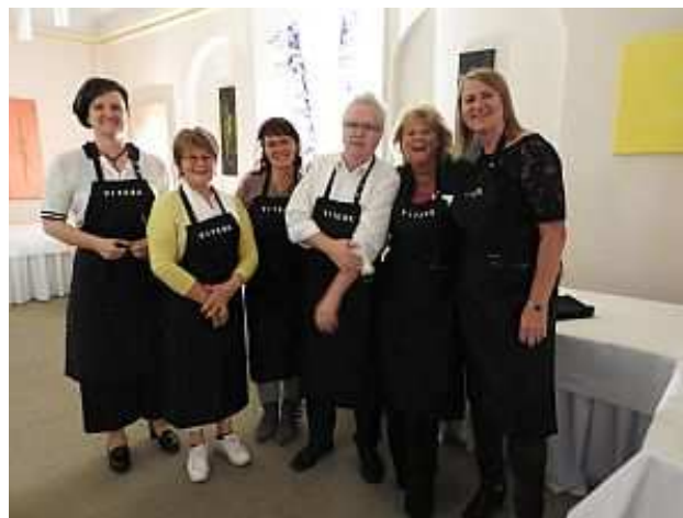
Einige Teilnehmer des Landesverbandstages beteiligten sich aktiv an der Zubereitung des Essens.

Der diesjährige Landesverbandstag des Bund der Selbständigen Sachsen fand am 08.09.2017 in Leipzig statt. Organisiert wurde der Landesverbandstag vom Mitgliedsbetrieb – VITERA® Institut für Gesundheit & Prävention. Ganz in diesem Sinne hatten die Teilnehmer Gelegenheit, aktiv die Elemente Bewegen mit Spaß, Entfalten mit Gelassenheit und Essen und Trinken mit Genuss auszuprobieren. So wurden gesunde Smoothies und Wein verkostet, Yoga Grundübungen erlernt und Übungen zur Verbesserung der körperlichen Fitness durchgeführt. Ganz entspannt ging es dann zum Abendessen ins Restaurant & Café Gohliser Schlösschen, wo ein Teil der Teilnehmer aktiv in der Küche bei der Zubereitung des Essens mitmachte.